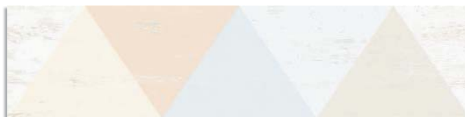
(3) Caria-R Blanco G.168