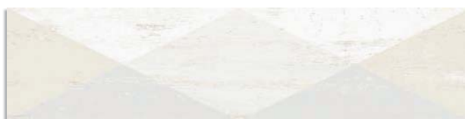
(2) Dion-R Blanco G.168