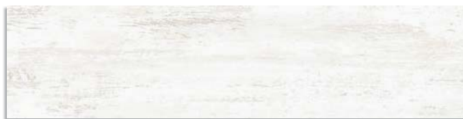
Efeso-R Blanco G.168