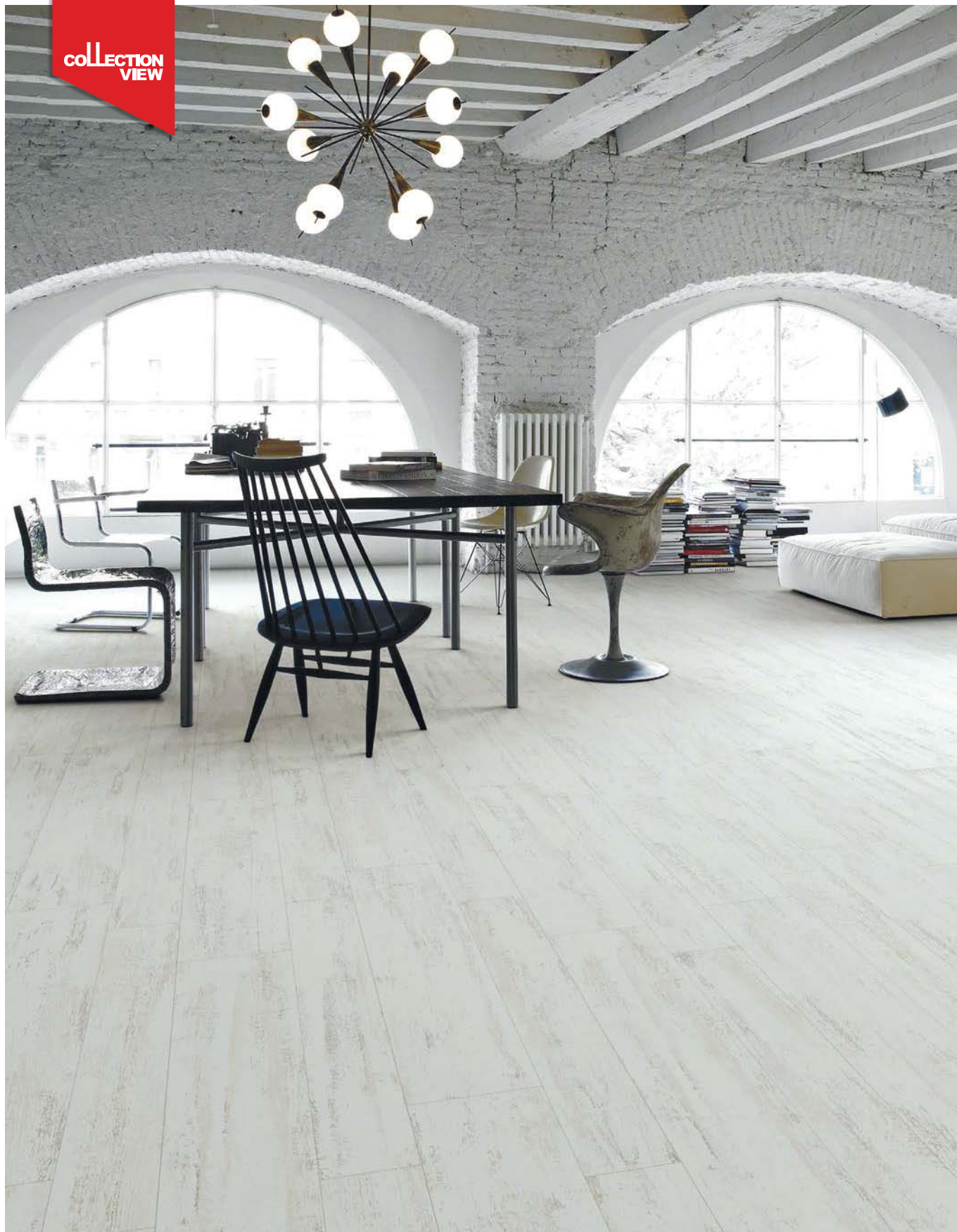
Efeso-R Blanco - 14,4x89,3 cm. / 21,8x89,3 cm.