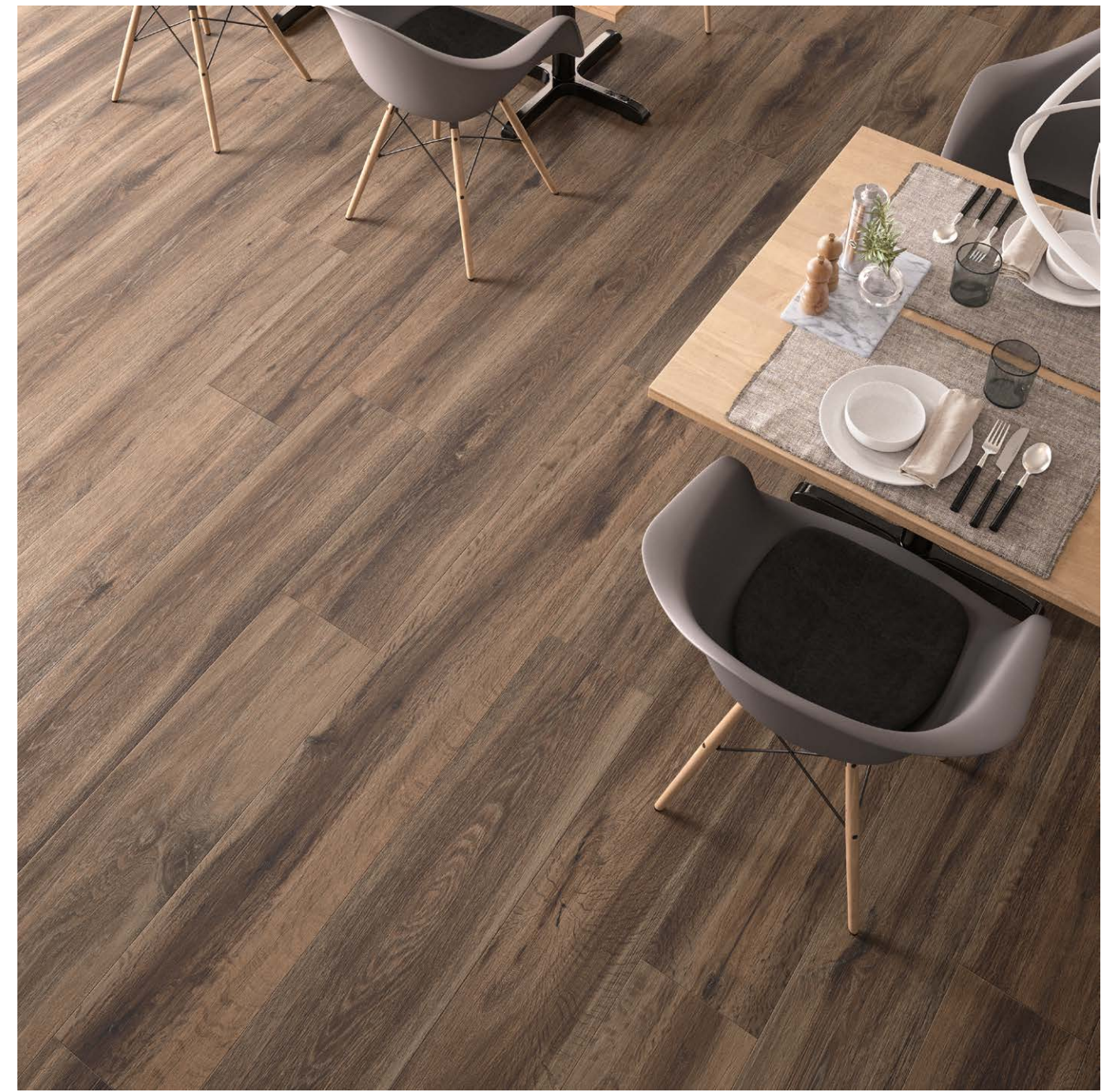
Barkwood Burnt 30180