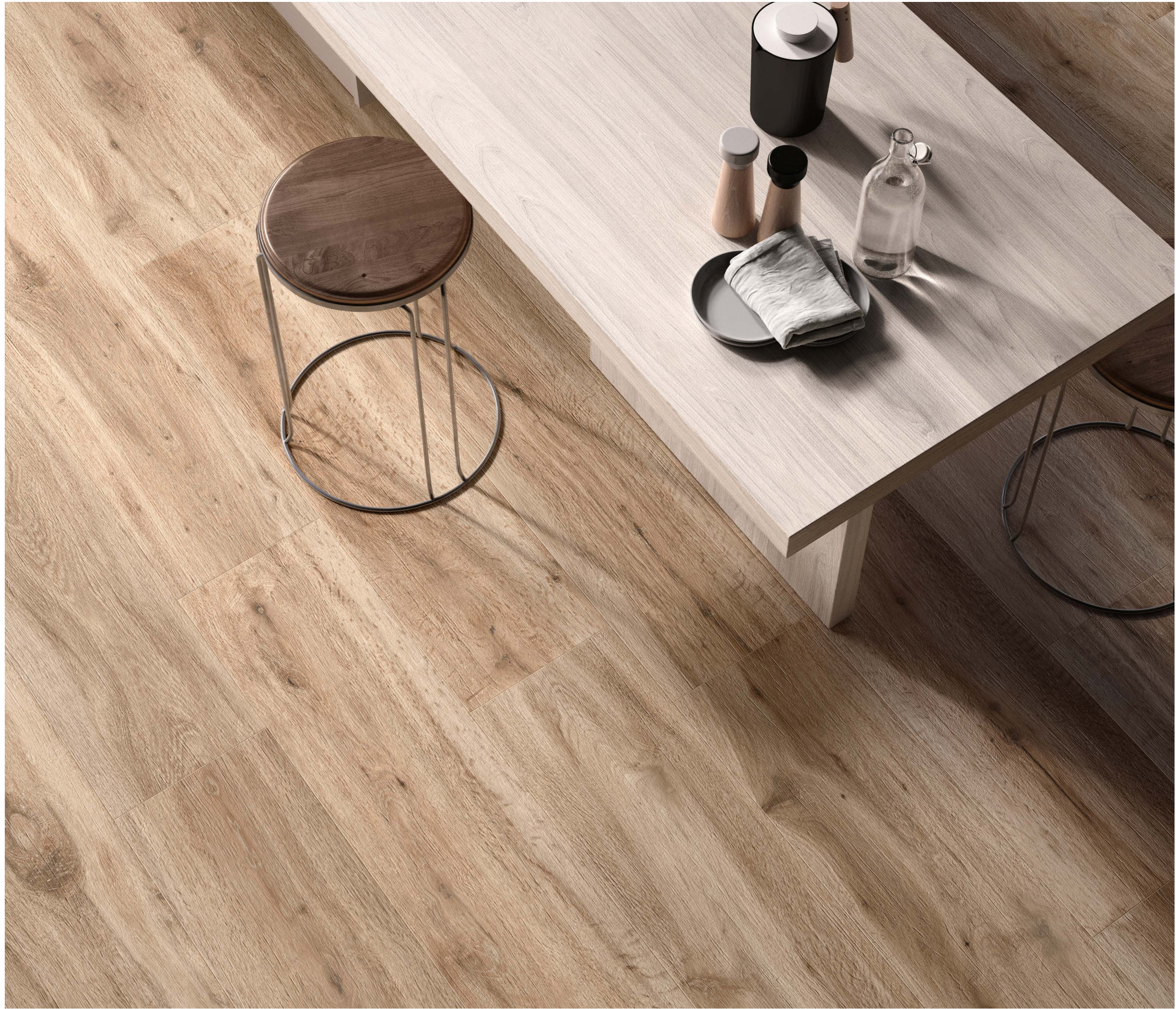
Barkwood Honey 30120