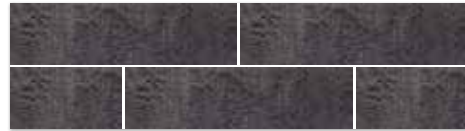
Płytki elewacyjna A BAZALTO GRAFIT 30×8,1×1,1