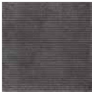
Płytki bazowa B BAZALTO GRAFIT 30×30×1,1