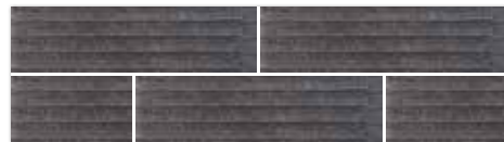
Płytki elewacyjna C BAZALTO GRAFIT 30×8,1×1,1