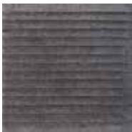
Płytki bazowa C BAZALTO GRAFIT 30×30×1,1