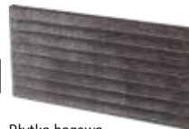
Płytki bazowa podstopnicowa C BAZALTO GRAFIT 14,8×30×1,1