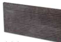
Płytki bazowa podstopnicowa B BAZALTO GRAFIT 14,8×30×1,1