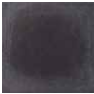
Płytki bazowa A BAZALTO GRAFIT 30×30×1,1