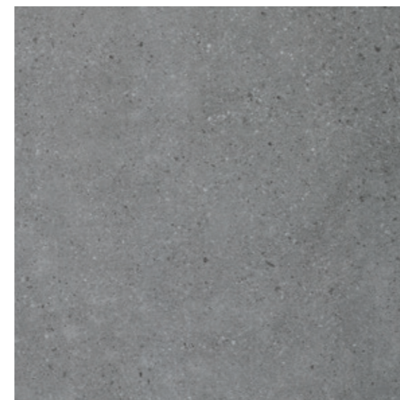
GT 13 59,7x59,7 cm natura R10 59,7x59,7 cm lappato mat R10