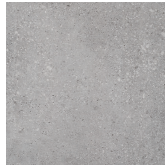
GT 12 59,7x59,7 cm natura R10 59,7x59,7 cm lappato mat R10