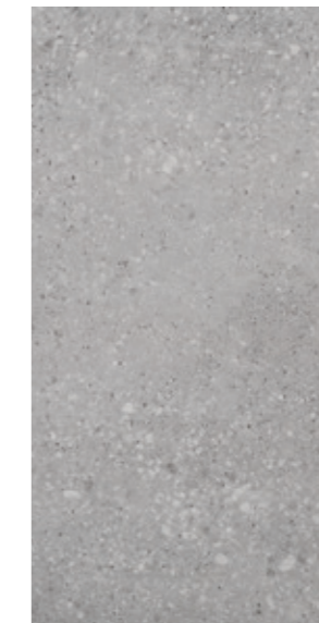
GT 12 29,7x59,7 cm natura R10 29,7x59,7 cm lappato mat R10