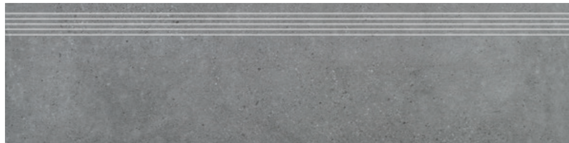
Stopnica GT 13 29,7x119,7, 29,7x59,7 cm natura R10 29,7x119,7, 29,7x59,7 cm lappato mat R10