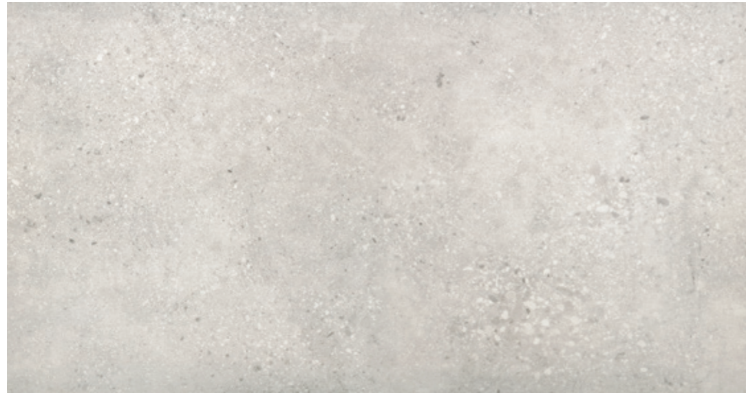
GT 10 59,7x119,7 cm natura R10 59,7x119,7 cm lappato mat R10