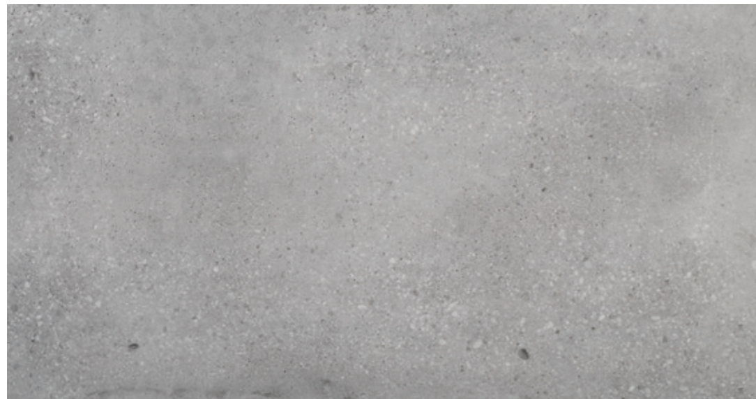
GT 12 59,7x119,7 cm natura R10 59,7x119,7 cm lappato mat R10