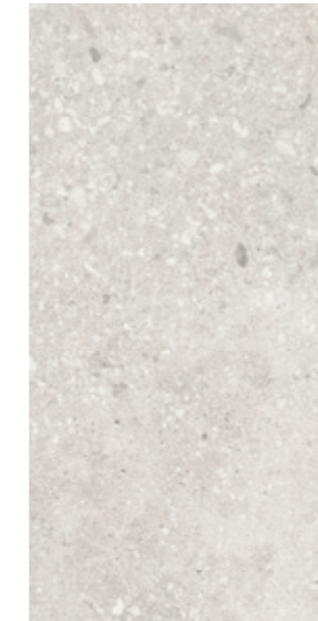
GT 10 29,7x59,7 cm natura R10 29,7x59,7 cm lappato mat R10