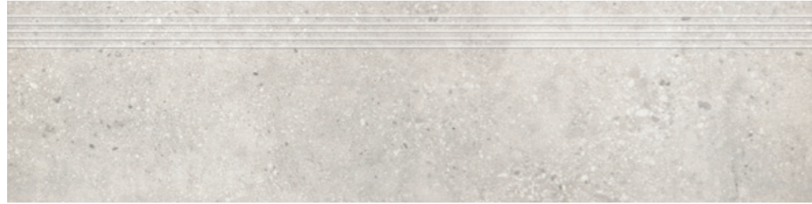
Stopnica GT 10 29,7x119,7, 29,7x59,7 cm natura R10 29,7x119,7, 29,7x59,7 cm lappato mat R10

Stopnica / Stair tread tiles / Treppenstufen / Ступеньки Cokół / Skirting / Sockel / Плинтусы