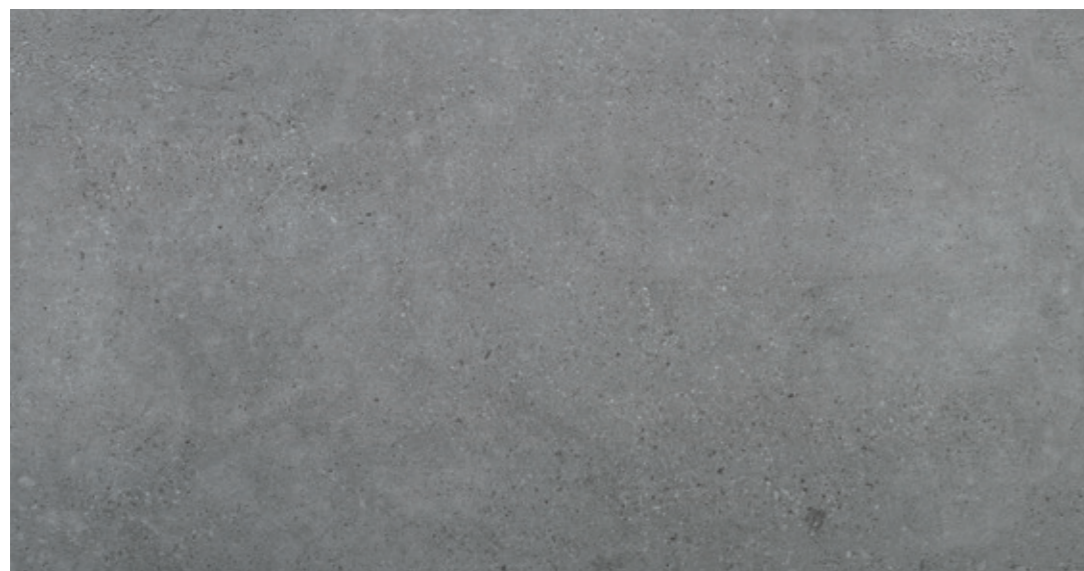
GT 13 59,7x119,7 cm natura R10 59,7x119,7 cm lappato mat R10