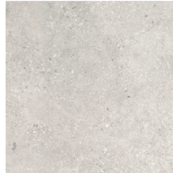
GT 10 59,7x59,7 cm natura R10 59,7x59,7 cm lappato mat R10