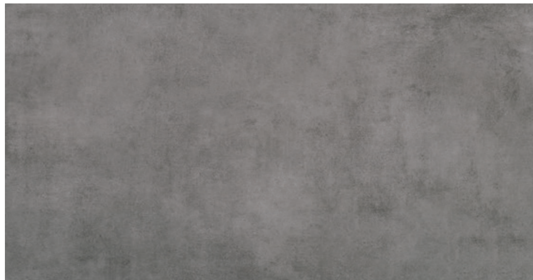
AV 13 59,7x119,7 cm natura R10 59,7x119,7 cm lappato R10