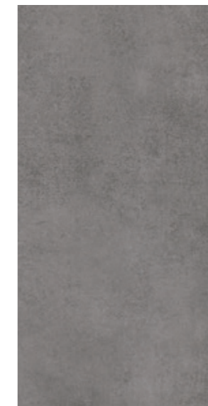
AV 13 29,7x59,7 cm natura R10 29,7x59,7 cm lappato R10