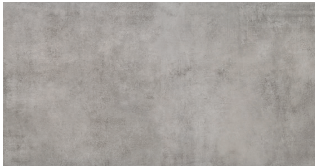
AV 12 59,7x119,7 cm natura R10 59,7x119,7 cm lappato R10