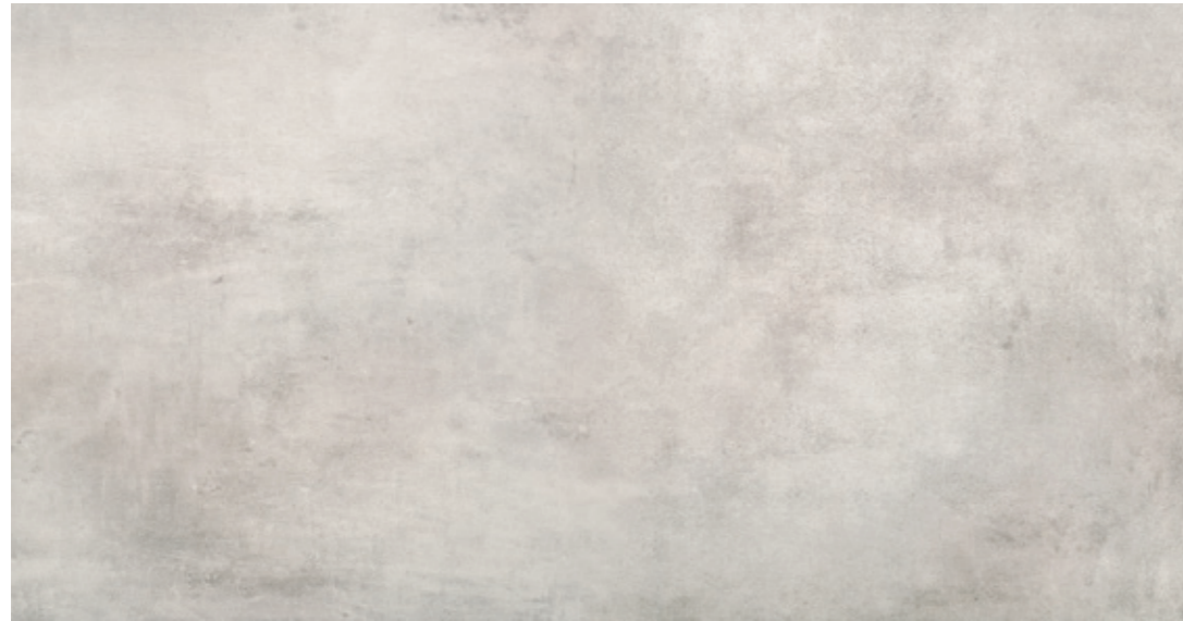
AV 10 59,7x119,7 cm natura R10 59,7x119,7 cm lappato R10