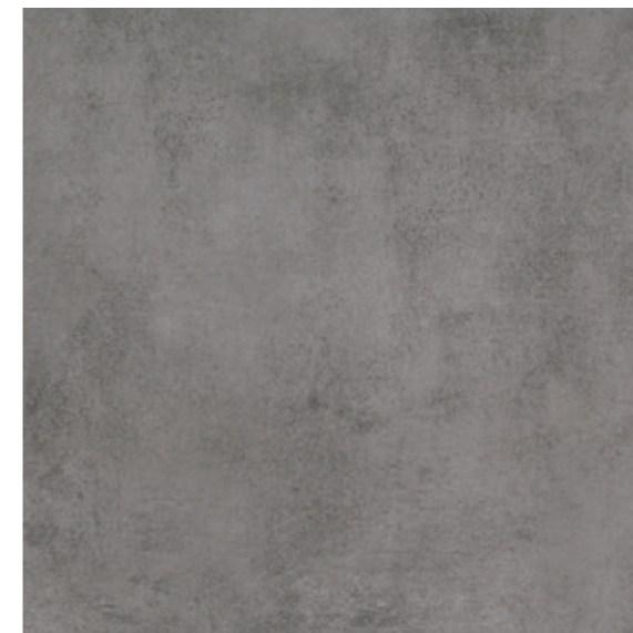
AV 13 59,7x59,7 cm natura R10 59,7x59,7 cm lappato R10