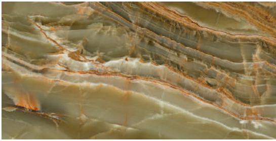
EMERALD ONIX POL RECT 60 X 120 / 24" X 48"