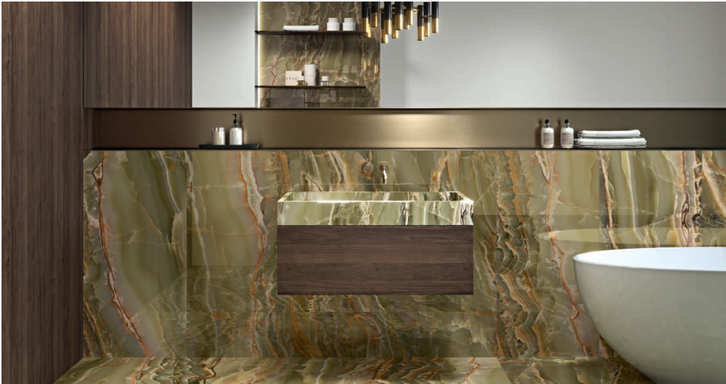
EMERALD ONIX POL RECT · 60X120. PUMICE MATT RECT 60X120.